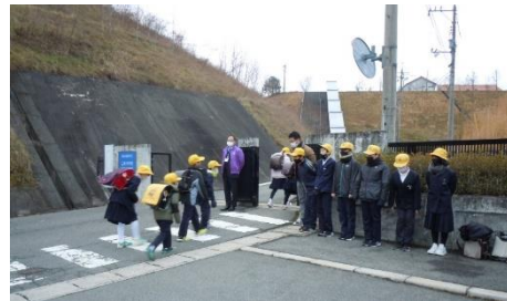
児童会によるあいさつ運動

1月7日(金),児童会が中心となり,登校時,校門のところであいさつ運動を行いました。 3学期スタートの日,みんなが気持ちよくスタートできるように,気持ちの良いあいさつで迎えてくれました。また,登校してきた児童も,大きな声であいさつを返していました。 今年度は,児童会を中心に,「あいさつレベル1~5」を決め,毎朝,児童会役員が児童玄関に立って,あいさつ運動を行っています。下校集会で,レベル5のあいさつをしている児童を紹介したり,毎月,全校集会で,「あいさつ名人」を認定したりしています。2学期からは,さらに先生賞も付け加え,学校全体で取り組んでいます。これらの取組により,自分からあいさつをする児童が増えてきています。