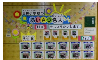
「あいさつ名人」認定