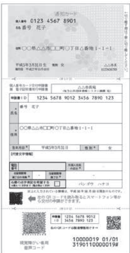
通知カード（みほん）