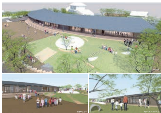
神石高原町立こばたけ保育所完成イメージ 令和5年秋開所予定

この日の授与式では、入江町長から名誉町民の証である記章などが手渡され、会場からは称賛の拍手が贈られました。