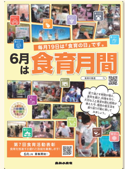
神石高原町食育推進ネットワーク協議会