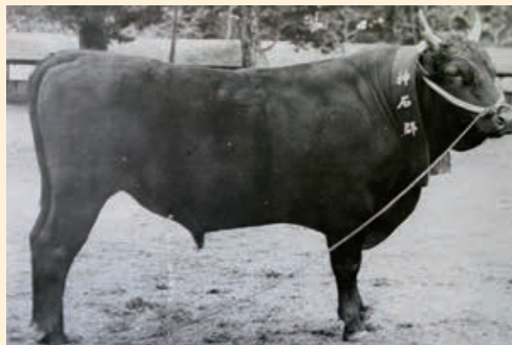
■大正天皇崩御の際に棺を牽引した神石牛の始祖牛「豊萬号」