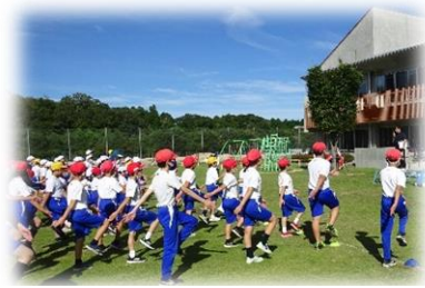
【運動会全体練習より】

8月26日に始業式を迎え、子ども達は2学期の学校生活に向けて新たな気持ちをもちました。始業式の中で校長から「二学期は大きな行事があり、普段の授業とともに行事の中で、考動力（自分や人のために考えて行動する力）を伸ばして欲しい」という話がありました。81日間の長い二学期、子ども達一人一人が目標をもって取り組み達成感を味わうとともに、互いに学び合う中で、成長し自信を高める充実した実りの多い学期となるよう、職員一丸となって取り組んでまいります。