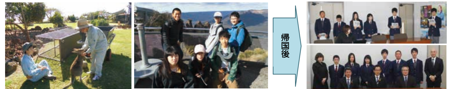
産ビ科生は農業実習も体験しました プルーマウンテンはとにかく壮大でした 町関係者に写真パネルで帰国報告