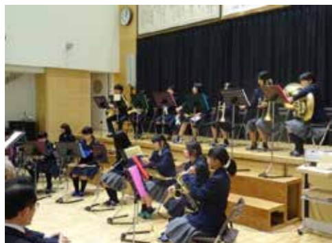
行事連携「中学校文化祭へ高校参加」: 11月4日 油木高音楽部員と顧問の先生が神石高原中文化祭へ賛助出演しました