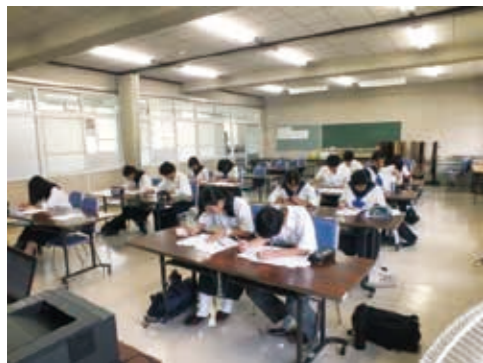
中学生版「はやぶさ塾体験会」: 8月18・22日 町内中3生希望者を対象に油木高で理科・社会科の塾体験会が実施されました