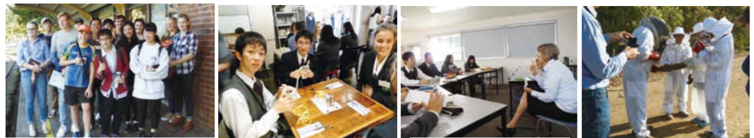
ホストファミリーとの楽しい休日 バディーとのモーニングティー 油高生のための英語授業 養蜂農家での研修