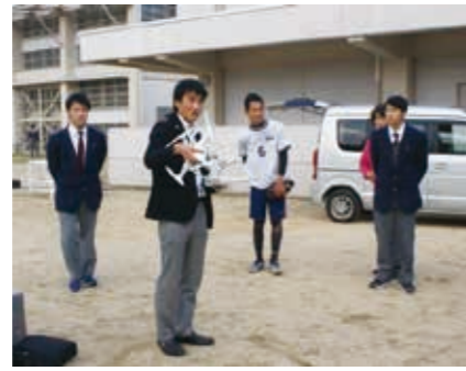
地域おこし研究员(貫洞:慶應大生)による高校生向けドローン教室(11/10)