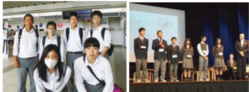
空港では少々みんな緊張気味 姉妹校での歓迎式典で自己紹介

SCHEDULE 2017 (7月27日～8月9日：14日間) 7/27:成田→/28:ブリスバナー/29:パソパナー (各人対ファミリー)→/30:ホストファミリーと休日→/31 ～8/4:主に学校・農場にて研修→8/5～6:ホストファミリーと休日→/7:ブルーマウンテン一日ツアー→/8:オーストラリア見学→21時出発→/9:羽田5時到着