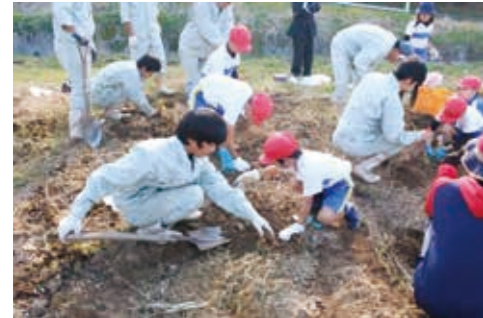
チャレンジ農園: 11月6日 油木小児童(2年生)が油木高産ビ科2年生からサツマイモの掘り方を教わりながら収穫しました