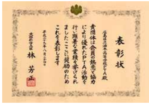
油高 PTA が優良団体として文科大臣表彰受賞(8/24)