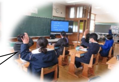
フランス・パリにある有名な門は?