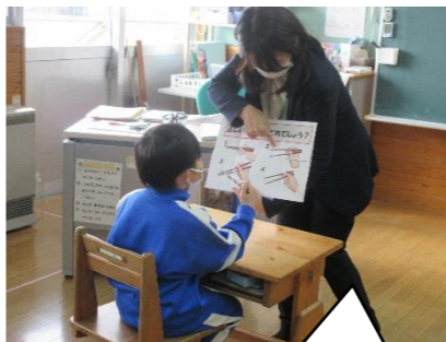
上手に使えるかな?