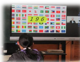
世界には、いくつの国があるでしょう?

5・6年生児童が、(株)阪急交通社と提携し、オンラインで世界の国々の様子について学びました。実際のツアーコンダクターさんを講師に、アメリカやフランス等の国の様子について、実際に旅行する感覚で映像を交えてお話いただきました。実施に現地を旅した方だからこそのお話もあり、オンラインならではの学習ができました。児童たちもクイズに答えたり、質問をしたりと積極的に学習していました。