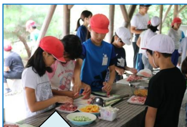
野外炊飯-炊き込みご飯・豚汁