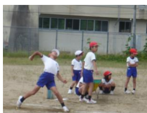
(ソフトボール投げ)