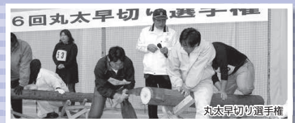
6回丸太早切り選手権