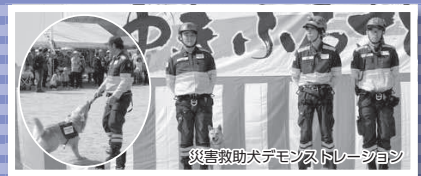
災害救助犬デモンストラーション