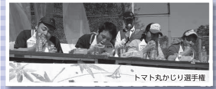
トマト丸かじり選手権