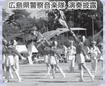
広島県警察音楽隊 演奏披露