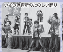
いずみ保育所のたのしい踊り