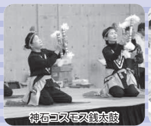
神石コスモス太鼓