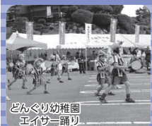
どんぐり幼稚園 エイサー踊り