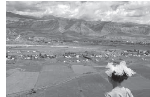
住んでいた村の写真

きになりました。「何か私にできること!何かを教えていかなきゃ!」という考えで挑んだキルギス生活でしたが、逆に多くの事を学び、村の人々に育ててもらった2年間でした。神石高原町での活動でも、たくさんの方々や交流し、学び、一方的ではなく住民の方々と共に考えた魅力的な町を皆さんと作っていかれたらと思っています。 2年間ですっかりキルギス通、キルギス好きになった私。最近では地域の方々とお話している中で、「キルギス」という言葉が交わされていることがなんだかすごくうれしいです。神石高原町の流行ワードに「キルギス」が仲間入りする日も近いのではとわくわくしています。そしてこんな風にいるんな場所「神石高原町」という言葉が交わされるように、たくさんの方々や発信していけたらさらにうれしいです。 私を見つけたらぜひぜひ声をかけてください!それではよろしくお願いたします。