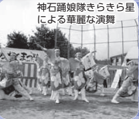
神石踊娘隊さらさら星 による華麗な演舞