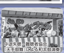
中途失聴・聴覚者協会 「天手鼓舞」による和太鼓演奏