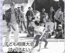
子ども相撲大会 はっけよい!!