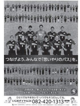
つなげよう。みんなで「思いやりのパス」を。

ひとりでもやらないで、いつでもうんたんしてね。 いじめダイヤル24 082-420-1313