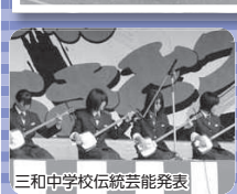
三和中学校伝統芸能発表