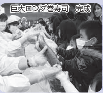
巨大うどん巻寿司 完成