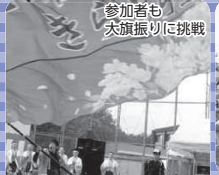
参加者も 大旗振り挑戦