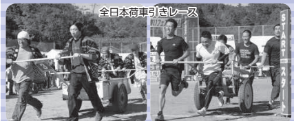
全日本車引きレース