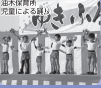
油木保育所 児童による踊り