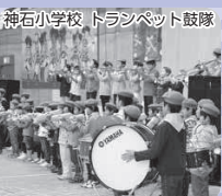
神石小学校 トランペット鼓隊