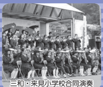
三和・来見小学校合同演奏