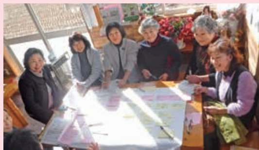
全国農業新聞1月17日付けより