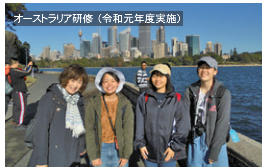
オーストラリア研修（令和元年度実施）