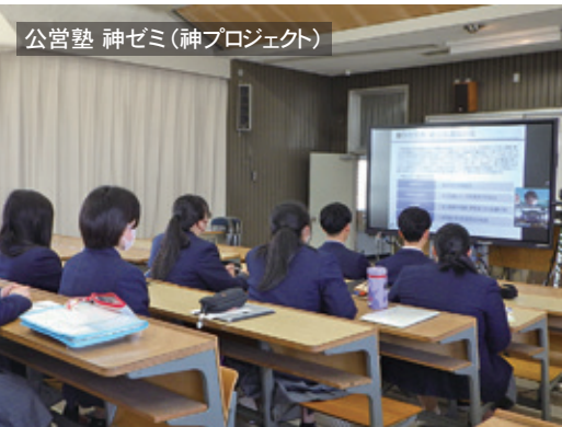
公営塾 神ゼミ(神プロジェクト)