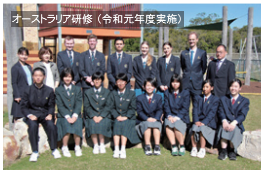
オーストラリア研修（令和元年度実施）