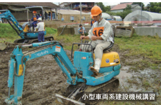
小型車両系建設機械講習