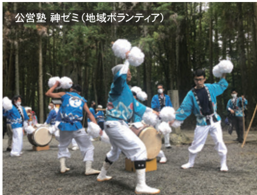
公営塾 神ゼミ(地域ボランティア)