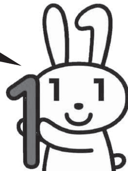
マイナンバー キャラクター 「マイナちゃん」

マイナンバーは原則、住民票の住所へ世帯ごとに届きます。 番号確認が必要となる「通知カード」や個人番号カードの申請書など、 大切な書類が入っています。 まちがって捨てないように してください。