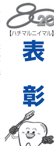
【ハチマルニイマル】