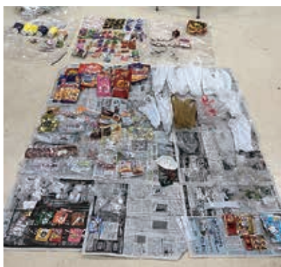
燃えるごみに入っていた プラ製品と分別できるもの

燃えるごみが出てい ます。これを一般的なCO 2 排出換算 に照らし合わせると、1年間で 680kg以上のCO 2 を排出している ことになりました。 また、先月にはごみ袋を開封 し、燃えるごみの内容を調査しま した。燃えるごみの中には、自動 販売機の紙コップや、カッププラ メンの容器、お菓子やパンの包装 紙なども含まれており、それらの 総量は燃えるごみの量の2割にも なるという結果が得られました。 神石高原町では燃えるごみを固 形燃料化していますので、前記の ような数字とは単純な比較はでき ませんが、自分たちが出している 燃えるごみの現状と、町で燃える ごみがどう処理されているかを周 知するチャンスだと捉え、発表の 準備を進めています。