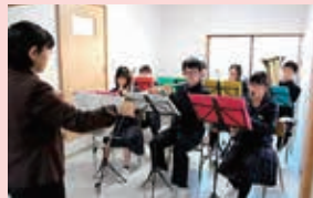
神石高原中学校音楽部による演奏