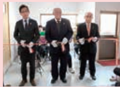
開設テープカット