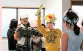
ゆきキッズクラブ Enjoy English による英語劇