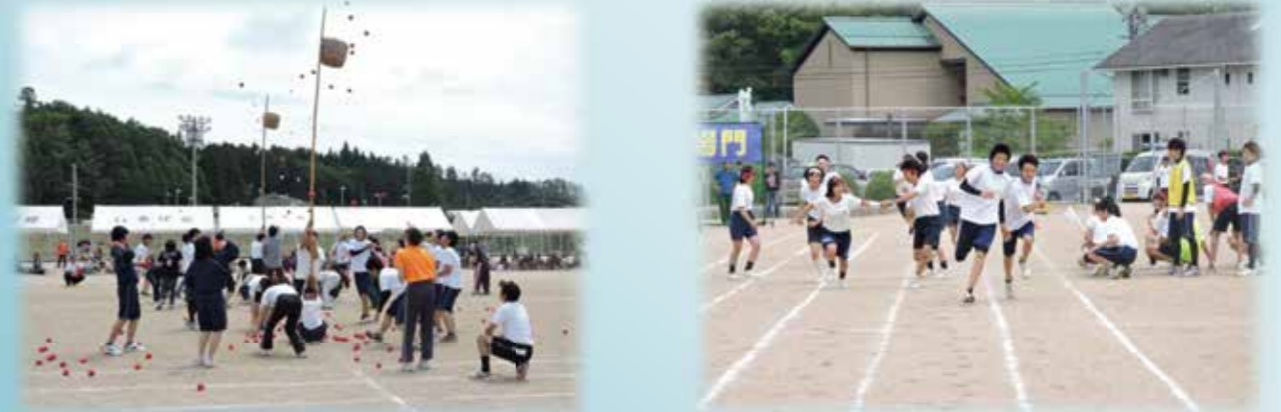
(神石高原中学校体育祭へ油木高生徒も参加し、盛り上げていただきました。)