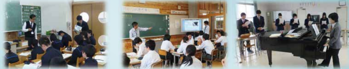
(高校から中学校へ数学指導に)