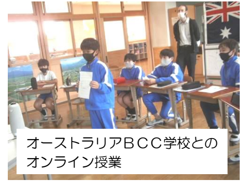
オーストラリアBCC学校との オンライン授業