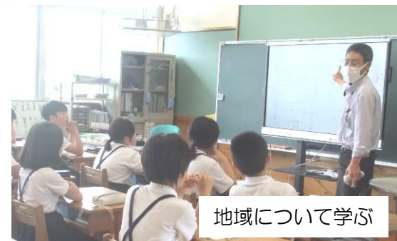
地域について学ぶ