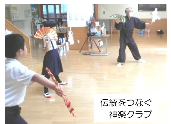
伝統をつなぐ 神楽クラブ