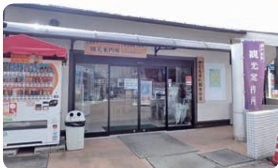
(一社) 神石高原町観光協会