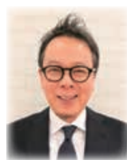
池内プロジェクト マネージャー

流れを変える無料の相談機関です。新たにブランディング経験豊富な池内プロジェクトマネージャーが着任し、よりスピード感を増して対応できるようにになりました。ぜひ、ご利用ください。