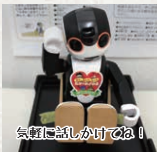
気軽に話しかけてね!

そして、新しい職員として、ロボット職員「ロボホン」を採用し、道の駅で観光案内に従事させています。それに伴い、スマートフォンの観光アプリを作成し、イベント情報などを発信しています。