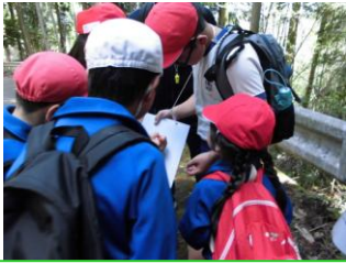
班で知恵を出し合い、クイズに挑戦