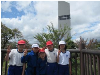
頂上から見る眺めは、最高で〜す