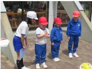
1年生3人にインタビュー