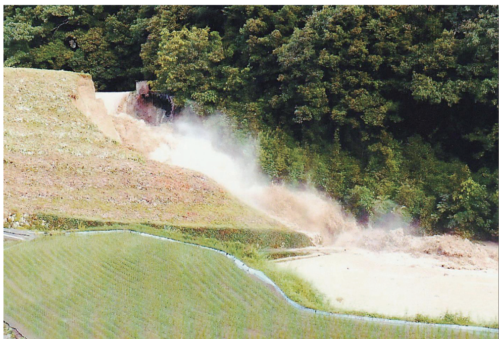
平成28年6月23日に発生したため池の決壊状況（福山市）