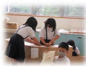
図工室をお化け屋敷に。 3・4年生の大作です。