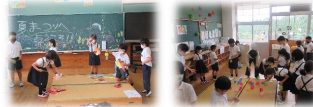
ひまわり学級で夏祭りを計画。盛り上がりました！ 魚釣り、水風船、ボウリング、大勢が集まり楽しみました！