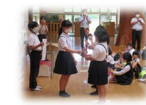
委員会の企画、草取り朝会の表彰式。たくさん取りました。