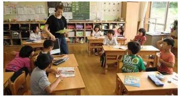
＜外国語活動での1コマ＞

11日(水)に外国語活動で、“I like ~”の学習を行いました。ALTの先生に“Do you like ~?”と質問されたら、“Yes, I do.”と答えたり、“No, I don’t.”と答えたりしました。児童たちは楽しそうに外国語活動に取り組んでいました。