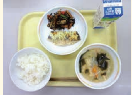
※提供できていないため写真は参考