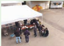
神石高原マルシェ(百彩館にて)

【お問い合わせ先】総務課 ☎89・3330 宝物です。出来事は、私にとって大切な思い出です。その時の写真や出来事は、私にとって大切な宝物です。