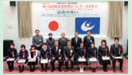
平成30年度読書感想文コンクール表彰式の様子