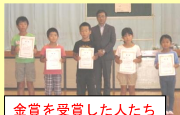
金賞を受賞した人たち