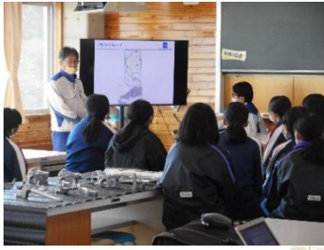
《トラスト神石》 何度でも再利用できる金属。あんなに堅くて丈夫な金属が、湯せんで溶ける！それもまるで水のよう。不思議な体験です。