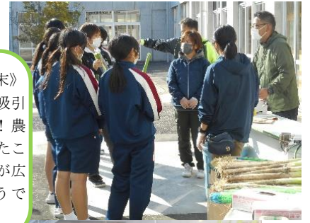
《ヴィレッジホーム光末》 ネギの皮をむく機械の吸引力におっかなびっくり!! 農業をやっていてよかったことは、人とのつながりが広がっていくことだそうです。