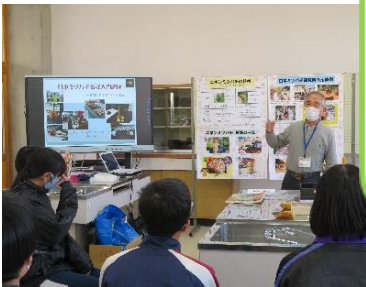
《神石高原 日本ミツバチ研究所》 ニホンミツバチの不思議で繊細な生態について、たくさん紹介していただきました。サラサラしていて口の中に豊かな香りがいっぱい広がりました。