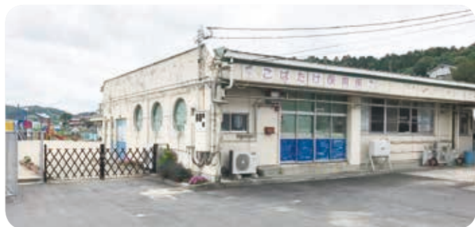
建替えが望まれるこばたけ保育所

150人に削減する予定。不具合は生じないか。 Q 町長 各種事務事業の見直しや廃止、民間委託、機構改革、選択と集中により、確実に業務を遂行する。 Q 協働支援センターへの押し付けはないか。 A 町長 役場の業務を押し付けることはない。 十分な話し合いが出来るような期間をもって、提案・説明をする。