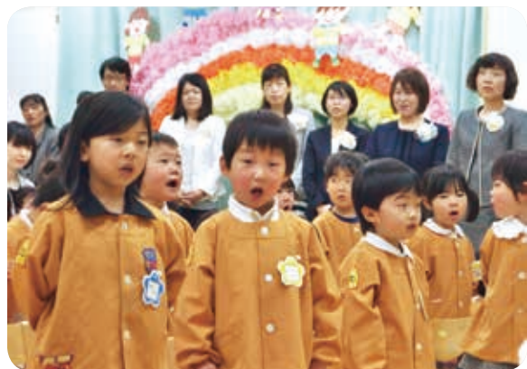
元気に歌う子どもたち（油木保育所入所式）