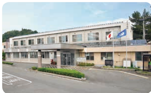
築59年経った本庁舎南棟

の負債を残すべきでない。 A 町長 将来に負債を残すことのないよう有利な財源がある今、建設する。