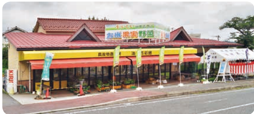
イベント期間中の百彩館（油木）

らどうか。 A 町長 廃止すれば町の支払っている地代920万円を今後は払い続ける必要がなくなる。現在の手数料も25%以下で出荷できれば農家にとってその方が良いと思う。