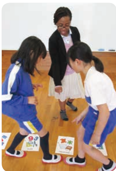
ALT講師による英語授業（神石小学校）