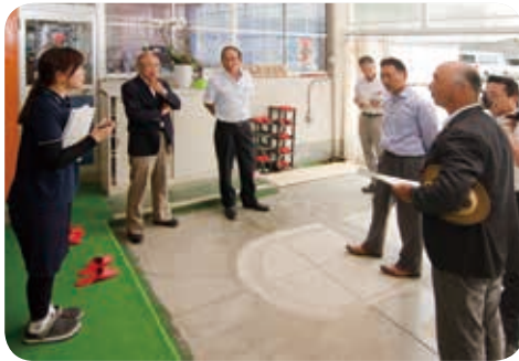
くるみ保育所の現状をきく

安全管理上と衛生管理上問題がある場合は、現地調査をしっかりと行い、早急な対応をすること。