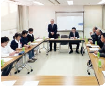
現場の要望をきく委員

要望事項については、役場担当課と十分に打合せを行い、議会として可能な限り協力を行うという方向性を出した。