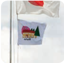
運動会で掲揚された村旗