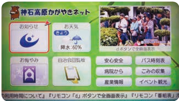
現在の「かがやきネット」のトップ画面