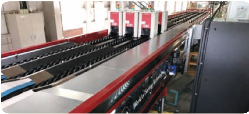
新設されたオランダ製の選果機

生産者が出荷したトマトは新設された集荷用予冷庫に保管し、翌日選果機により、大きさ・色などにより選別、箱詰めされる。トラックに積込むまで、鮮度を保つよう出荷用の予冷庫で保管をする。処理能力は、1.5倍となった。