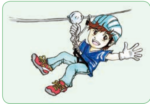
ロープウェイ型遊具 ジップライン