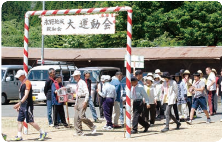
運動会は、ながの村内の各地区対抗で行われます