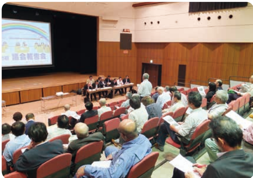
活発な意見があった議会報告会（豊松会場）