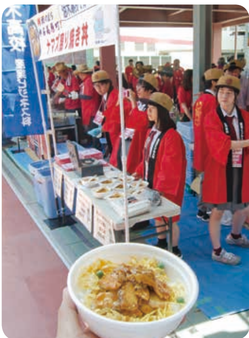
ナマズてりやき丼を販売する油木高校生 (マツダスタジアム)