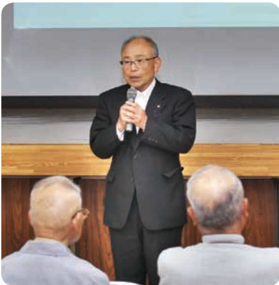
住民の質問に答える松本議長（三和会場）

住民 28年度はイノシシを1200頭余り捕獲した。350万円を3年間出すのなら駆除班へ。