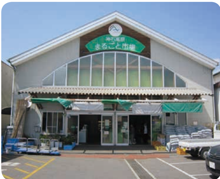
今後の方向性の検討が必要なまるごと市場

油木百彩館・さんわ182ステーションの経営統合計画は、手数料や集荷体制、客層にあわせた