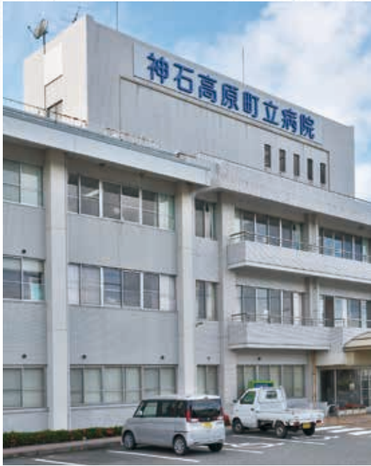
新築移転が決まった町立病院