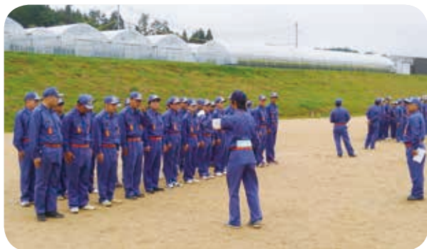
訓練に励む消防団（油木方面隊）

Q 今後学校現場で教職員の負担が大きく子ども向き合う時間が減ると考える。加配も考え