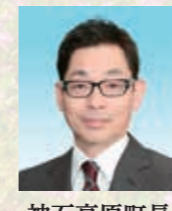
神石高原町長 入江 嘉則