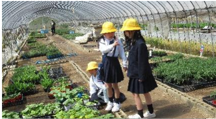
1・2年生 入江園芸で苗を買いました

今年も地域に出かけたり、地域の皆様に来ていただいたりして、地域の良さや人の生き方を学び、来見に住む自分の自己肯定感を高めたりこれからの生き方を考えたりしたいと思います。地域の皆様、今年もお世話になります。よろしくお願いいたします。