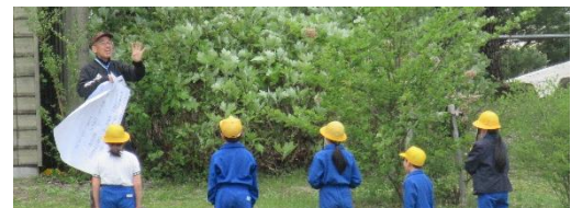
たてわり班でのウォークラリーで「校歌を大きな声で歌う」というミッションに挑戦中