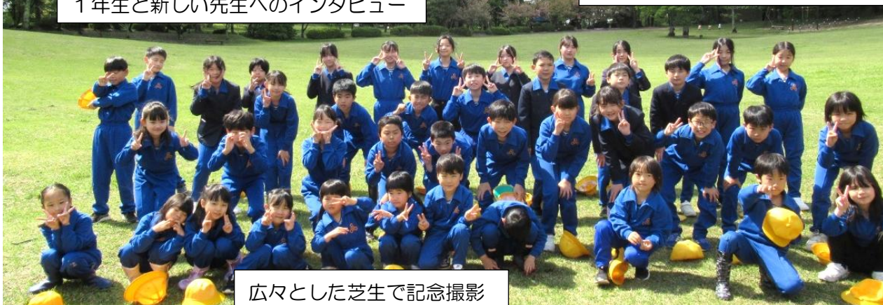
広々とした芝生で記念撮影