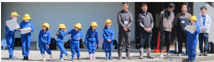
1年生と新しい先生へのインタビュー

5月1日(金)、ティアガルテンに遠足に行ってきました。ティアガルテンでは、新1年生と新しく来られた先生を歓迎する行事と6年生の進行によるレクリエーションを行いました。また、縦割り班でのウォークラリーも楽しみました。6年生が4月当初から企画を考え、前日には、体育館で進行のリハーサルも行い、運営を立派にやりとげました。歓迎遠足という行事を成功させたことで、6年生はリーダーとしての自信をもてたのではないかと思います。自信をもたせるために、しっかりと準備を行い、成功したことを認め、ほめることで子どもは成長することを改めて感じました。これからの6年生の活躍に期待します。保護者の皆様には、お弁当の準備等ご協力いただき、ありがとうございました。