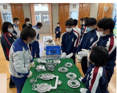
《トラスト神石》 アルミを溶かして作る部品は、みんなのよく知っている車に使われているとのこと。世界中を走っているのかもしれないね。合金の融解も体験させていただきました。