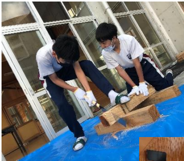
《佐々木林業》 “木”について色々お話をうかがった後、角材切り競争やオブジェ作りをしました。巨大な火起こしも体験させていただきました。角材切り競争、最速は38秒ちょっと。なかなかの記録です。