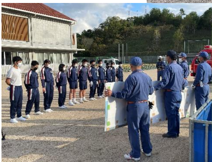
《消防団三和方面隊》 本職を持ちながらも、消防団として活動する、その想いを聴かせていただいた後、放水訓練を体験させていただきました。弱めていただきましたが、それでも水の勢いは強く、貴重な体験をさせていただきました。