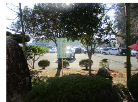
被爆アオギリ 神石高原町役場近く