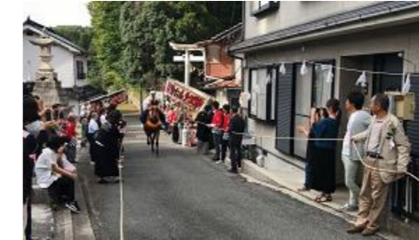
やぶさめ神事（広島県の無形民俗文化財に指定の一部） 豊松小学校近く