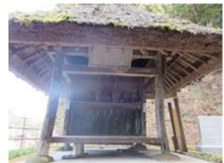
油木 詩の御堂 西行法師ゆかりの地