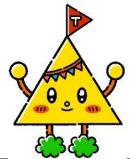
とよまる公園キャラクター 「とよきゃん」