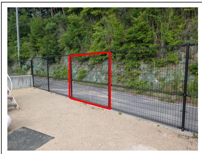
(3) フェンス出入口設置