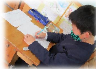
黙々と作っています!

生活科の『これまでのわたし これからのわたし』のために、すてきな写真とエピソードをご用意いただき、ありがとうございます。一人一人の成長ブックの製作は順調に進んでいます。今よりもっと小さかった頃の写真を見合っては、「かわいい〜♡」「今と変わってない!」など言いながら、完成に向けて一生懸命に取り組んでいます。完成したブックを見るのが、今から楽しみです♪