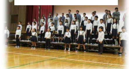
Smile Again 太陽のサンバ