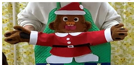
サンタゴリラさんと楽しいクリスマス