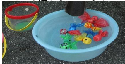
水あそび（水鉄砲・金魚すくい）