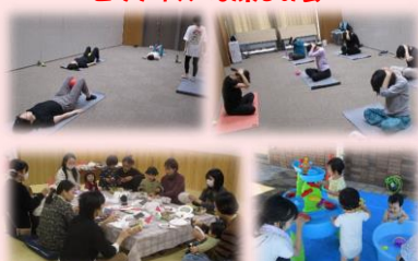
～ピラティス&お楽しみ会～